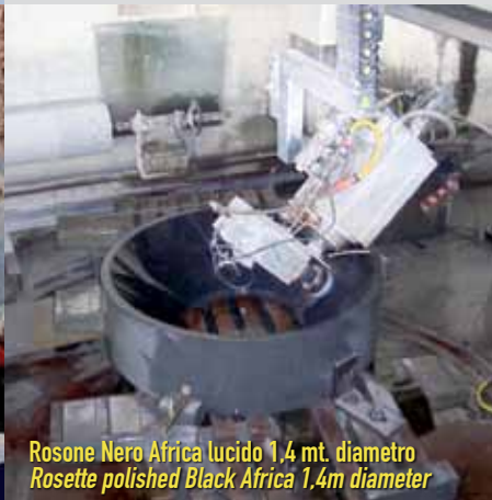
Rosone Nero Africa lucido 1,4 mt. diametro Rosette polished Black Africa 1,4m diameter