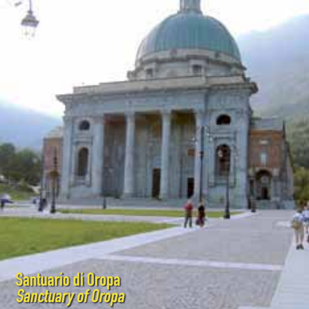
Santuario di Oropa Sanctuary of Oropa