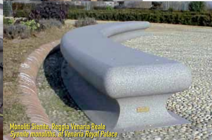
Monoliti Sienite, Reggia Venaria Reale Syenite monoliths, at Venaria Royal Palace