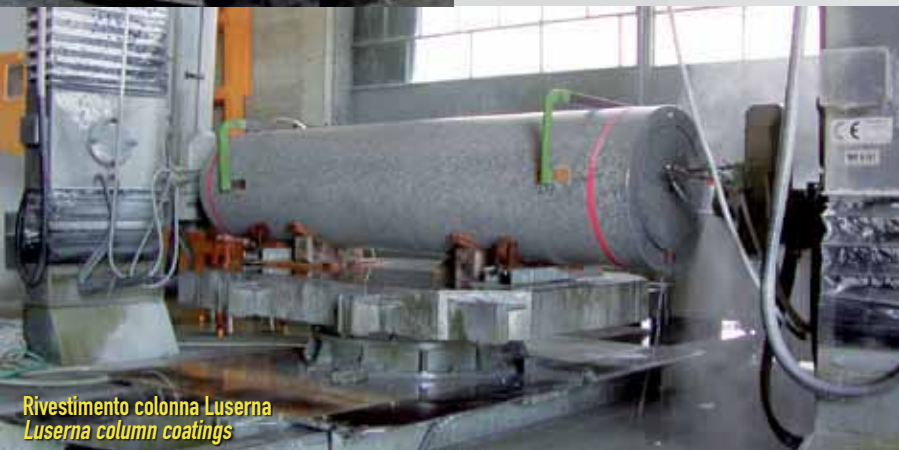
Rivestimento colonna Luserna Luserna column coatings