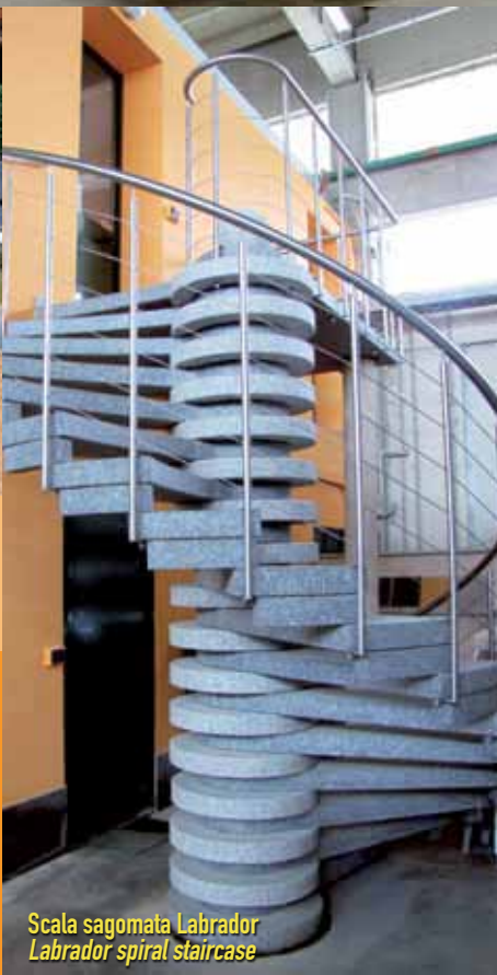
Scala sagomata Labrador Labrador spiral staircase