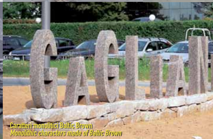
Caratteri-monolitici Baltic Brown Monolithic characters made of Baltic Brown

sabbiatura e pulizia sand blasting and stone cleaning