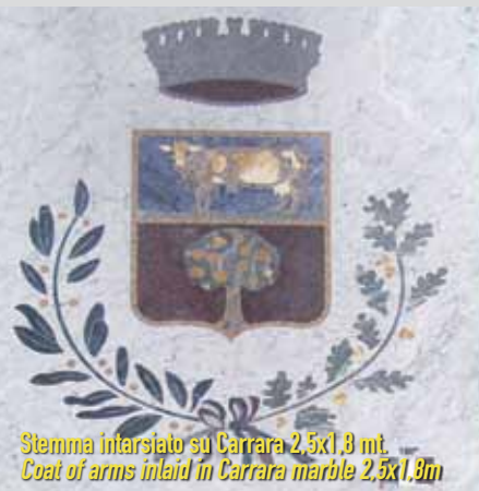
Stemma intarsiato su Carrara 2,5x1,8 mt. Coat of arms inlaid in Carrara marble 2,5x1,8m

conto proprio e conto terzi processing private and third parties orders