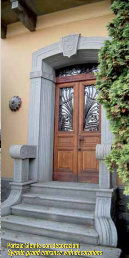
Portale Sienite con decorazioni Syenite grand entrance with decorations