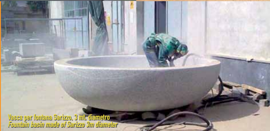
Vasca per fontana Sarizzo, 3 mt. diametro Fountain basin made of Sarizzo 3m diameter

sabbiatura e pulizia sand blasting and stone cleaning