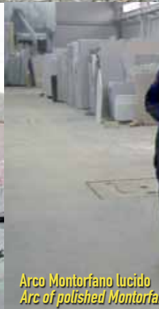
Arco Montorfano lucido Arc of polished Montorfano