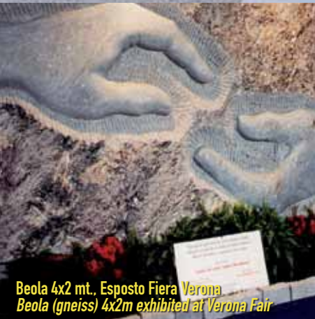
Beola 4x2 mt., Esposto Fiera Verona Beola (gneiss) 4x2m exhibited at Verona Fair