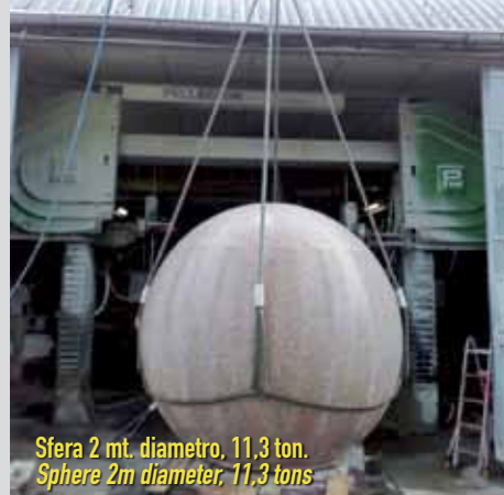
Sfera 2 mt. diametro, 11,3 ton. Sphere 2m diameter, 11,3 tons