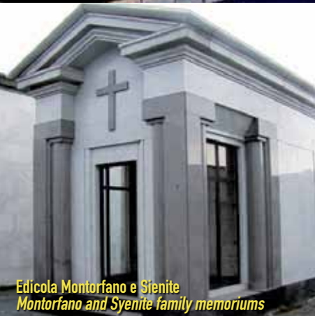
Edicola Montorfano e Sienite Montorfano and Syenite family memoriums